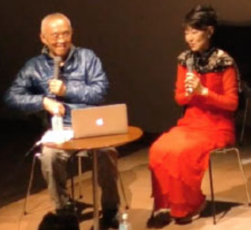
G. U. フォーレ (1845-1924)