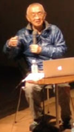
S. ジョブズ (1955-2011)

私が得た富は 一緒に持っていける ものではない 私が持っていけるものは 愛情に溢れた 思い出だけだ